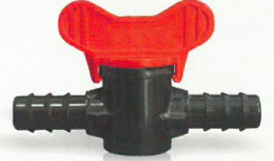
Mini Vana / Mini Valve