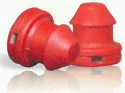
Damlatıcı / Dripper