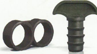
Kör Tapa / End Clamp