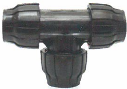
Capling TE / TEE Coupling