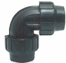
Capling Dirsek / Elbow Coupling