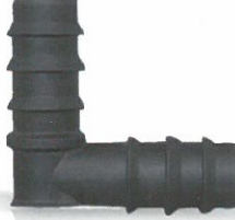
Dirsek / Elbow