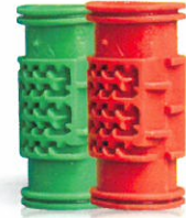
Drip / Drip