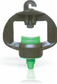
Mini Spring / Mini Spring