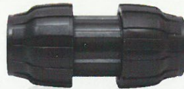
Capling Manşon / Coupling Muff